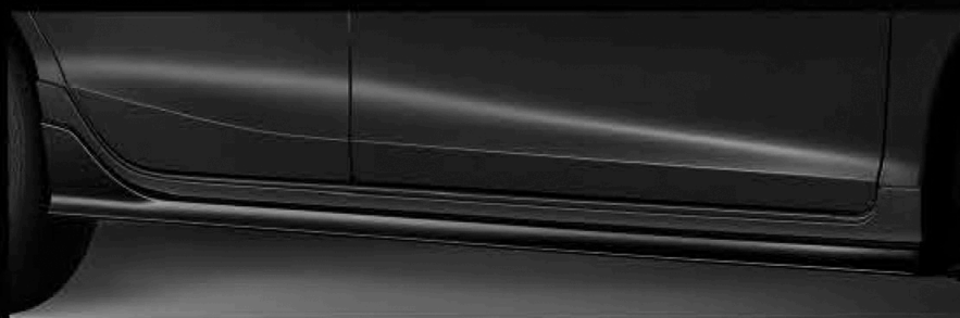
Side Under Spoiler