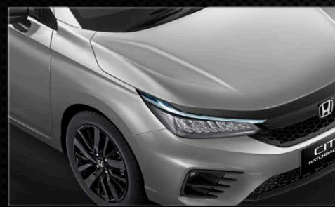
Lunar Silver Metallic