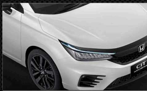
Platinum White Pearl