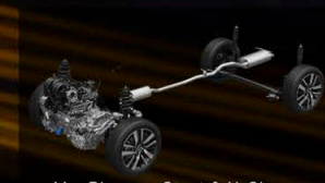
MacPherson Strut & H-Shape Torsion Beam Suspension