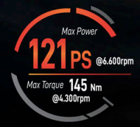
1.5L DOHC i-VTEC Engine