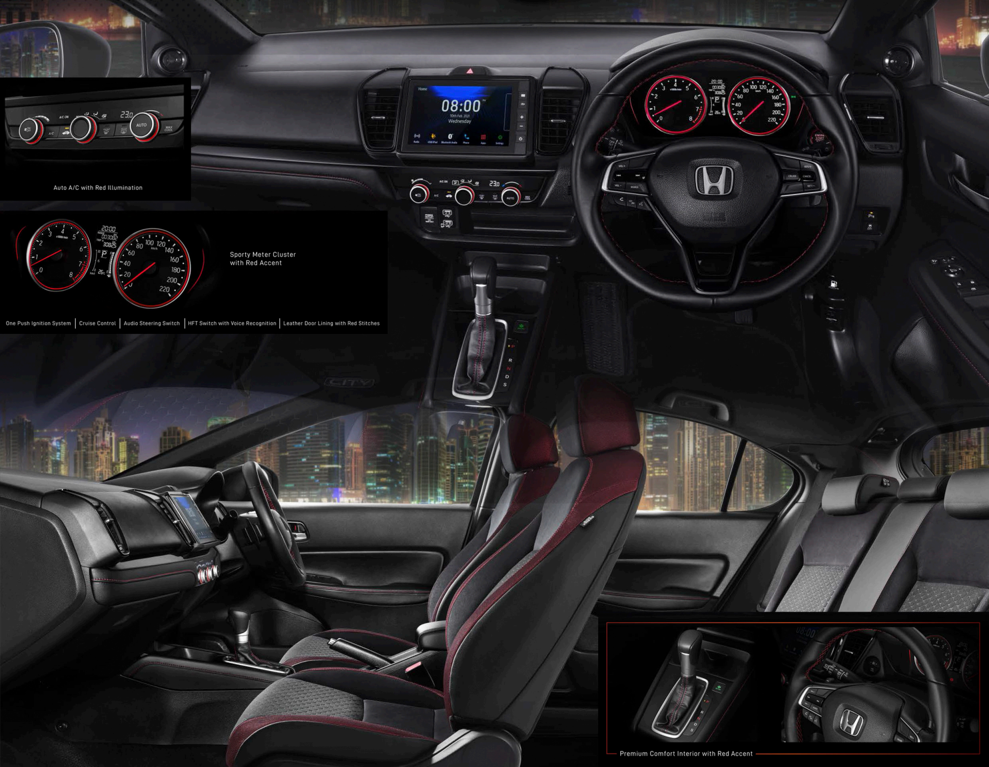
Auto A/C with Red Illumination