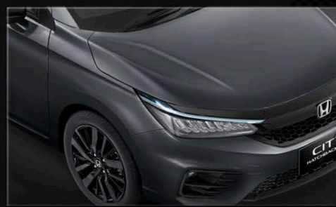
Meteoroid Gray Metallic