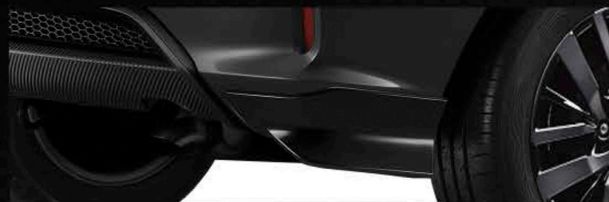
Rear Under Spoiler