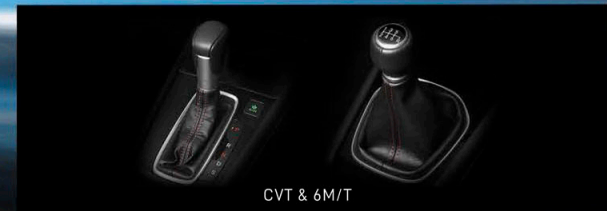
CVT & 6M/T