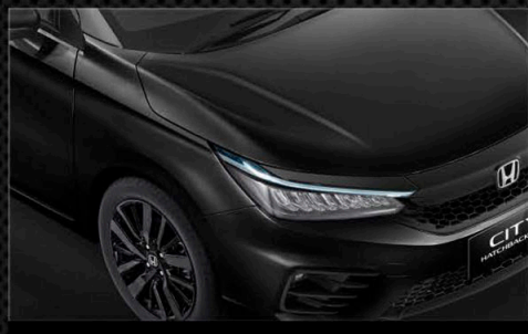
Crystal Black Pearl