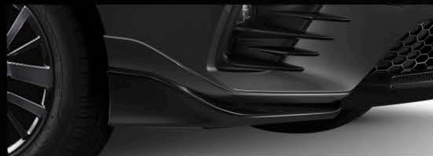
Front Under Spoiler